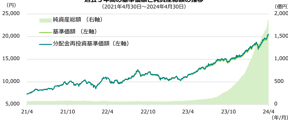
期間別騰落率 (2024年4月30日時点)